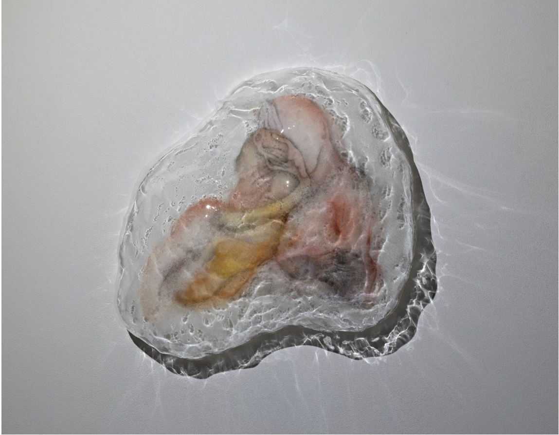
김가진, Placeholder IV , Print on transparent film, thermoformed acrylic, light, 2026, 38 x 40 x 12 cm